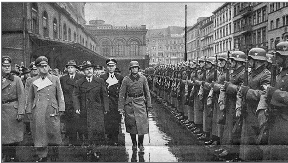
12 ноября 1940 года. Советская делегация под руководством В. Молотова в Берлине.