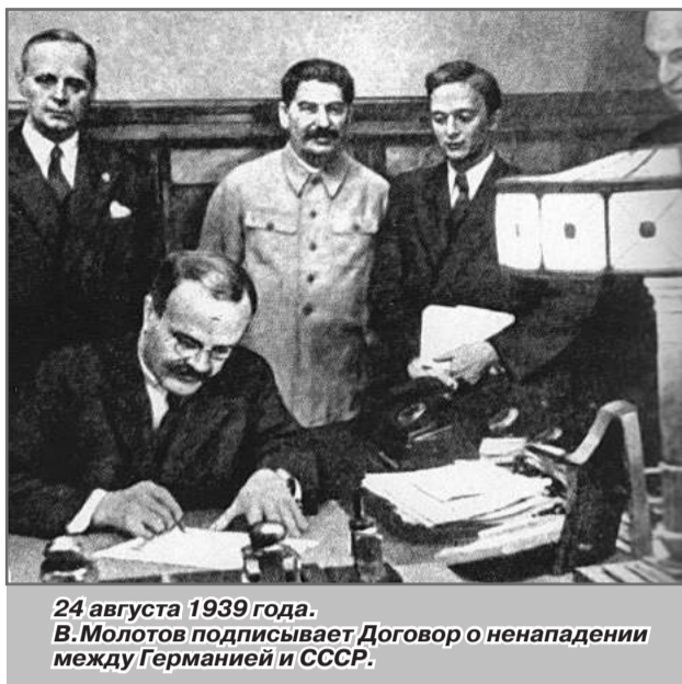
24 августа 1939 года. В. Молотов подписывает Договор о ненападении между Германией и СССР.

НСДАП в своём названии имеет слово «социалистическая», чтобы скрыть свои истинные цели, так как в предшествующем слове «националистическая» заложен смысл, соответствующий взглядам Розенберга - идеолога фашизма. Организаторами путча, находившимися в тюрьме, в 1925 году была написана книга «Майн кампф» (Моя борьба), автором которой был Гитлер. Он чётко сформулировал свои планы на будущее: «Мы кладём конец вечному движению на юг и запад Европы и обращаем свой взор к территориям на востоке», конкретизируя при этом: «Когда мы говорим о новых территориях в