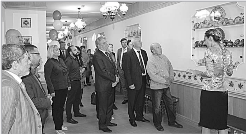
Музей-кафе уже посетило более полумиллиона жителей и гостей Владимирской области.